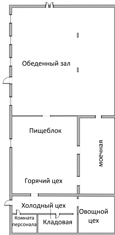
Схема пищеблока Междугорного филиала МБОУ «Октябрьская СОШ»